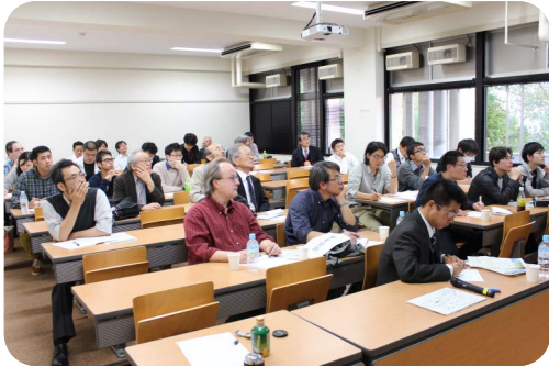
総参加者数 42 名、基礎数理演習室の様子

(英題: Modern Harmonic Analysis and Applications)